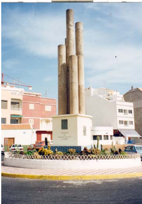
Güimar, AFU-Denkmal 1984