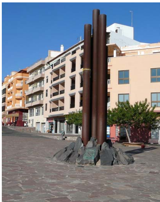
Güimar, AFU-Denkmal 2007